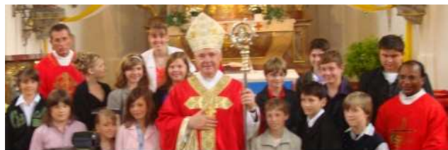
H.H. Bischof Gerhard Ludwig mit den Ortsgeistlichen und den Firmlingen in Arnschwang

H.H. Bischof Gerhard Ludwig spendete 76 Jugendlichen aus den Pfarreien Arnschwang, Dalking und Gleißenberg/Lixenried in der Pfarrkirche St. Martin das Sakrament der Firmung.