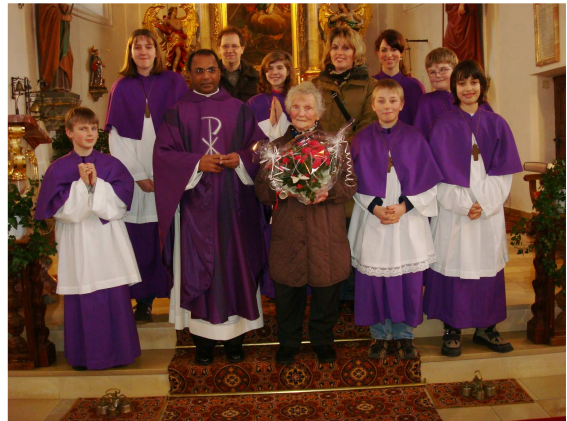
Pfarrer und Ministranten gratulieren nach dem Gottesdienst am Aschermittwoch